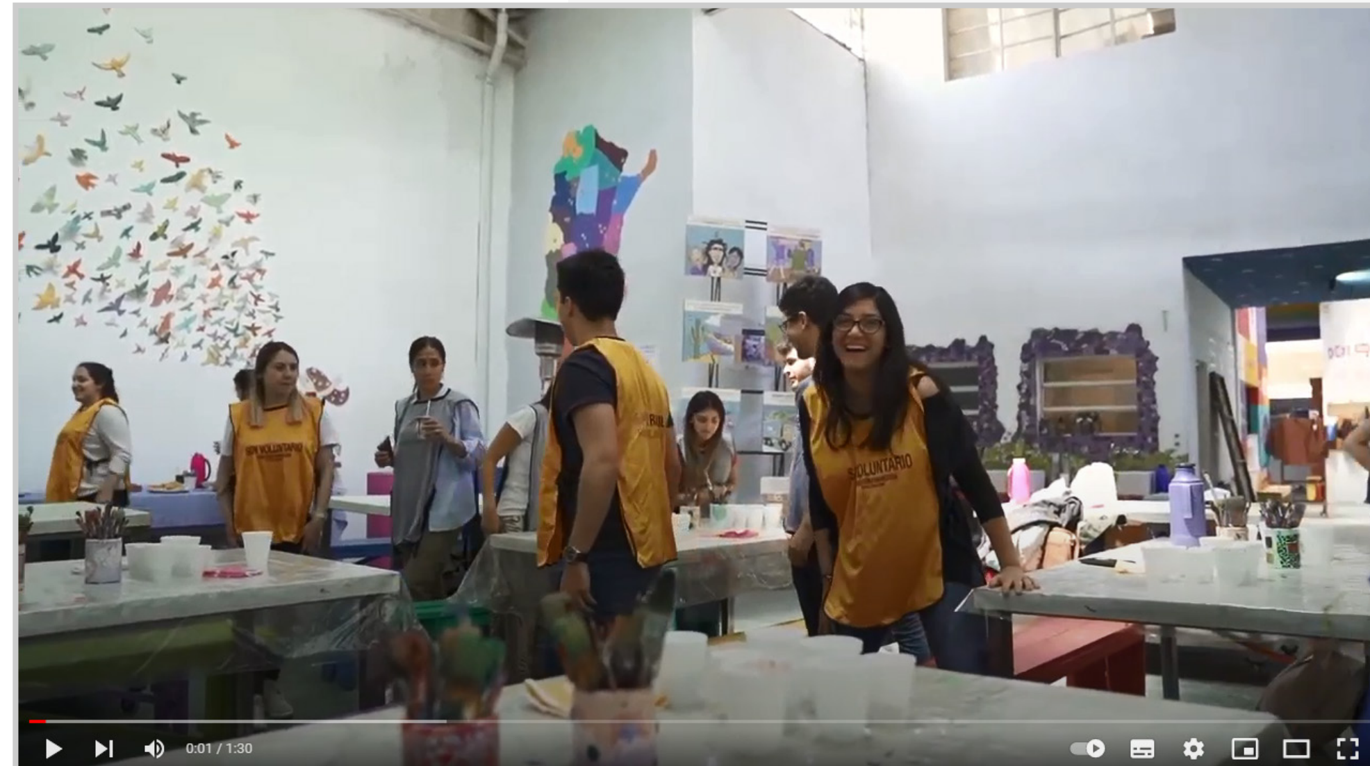
Jornada de Voluntariado - Fundacion Si (Video)