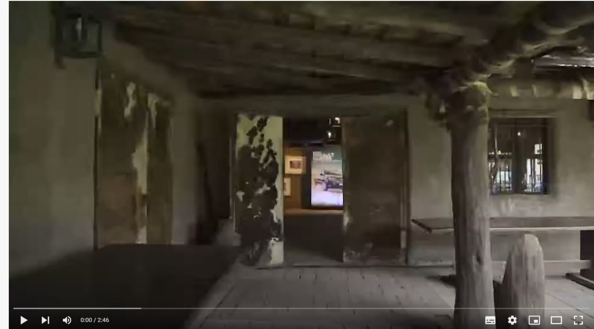
Proyectos Sustentables Duste (Video)